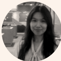
TAIWAN Taiwan Design Center