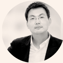
SHANGHAI s.point design