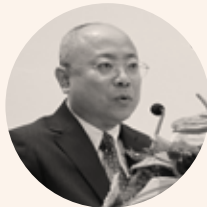
SHANGHAI Ausen-IDC International Design Center